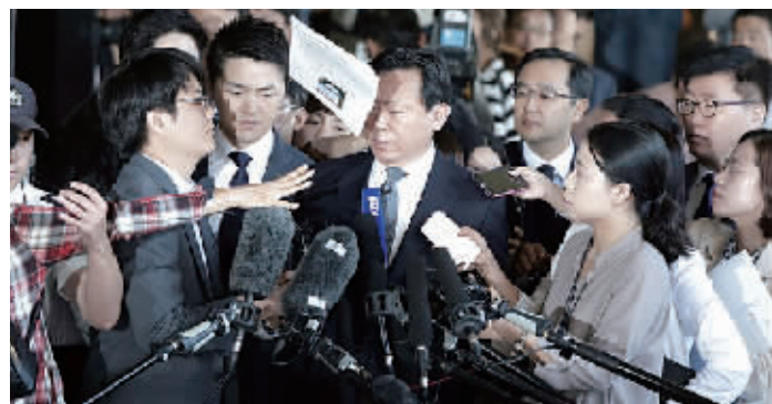
辛东彬接受采访时遭人扔纸攻击。

韩国司法界消息人士透露，首尔一家法院开始审理乐天集团会长辛东彬及其家人所涉的一系列案件，首场听证会于20日举行。此外，乐天集团免税店业务负责人因牵涉前总统朴槿惠“亲信干政”案，19日被首尔检方问询。