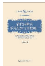
法律:《清代国家法》 作者:王志强 出版:社会科学文献出版社

没有哪个时代比中世纪更令人恐惧、敬畏,也没有哪个时代比中世纪更令人兴奋、惊叹。曼彻斯特以其优美的散文风格,带领我们领略了中世纪如何从摇摇欲坠到涅槃重生——书中展现了那个时代历史上最伟大的哲学家、改革家、探险家、艺术家、诗人,以及文艺复兴、宗教改革与大航海时代。