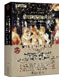
历史:《黎明破晓的世界》 作者:(美)曼彻斯特 出版:化学工业出版社

提高科学思维能力的途径在于改进思维方法,作为逻辑与科学思维方法论的研究课题,本书在科学逻辑的框架下,从科学推理的实用角度来编写。不仅详细介绍了科学的思维方法,而且结合丰富的科学案例来阐明如何发现问题、分析问题和解决问题,以此论述科学推理的原理与方法,从而启发思维并提升读者的科学推理技能。