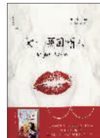
小说:《K—英国情人》 作者:虹影 出版:四川人民出版社

本书以法律多元的视角,以清代为中心,超越中央制定法的视野局限,力图在国家层面多角度透视当时法的存在状态,以求揭示国家法中所存在的地域性、结构性差异,以及纸面表达与实在规则的疏离。本书论述常贯通前代,溯其史源,是以清代为典型探索中国古代法,有助深化对其理论总结和全面评价。