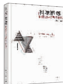
通识:《科学推理》 编著:周建武 出版:化学工业出版社

本书以英国《自然》(Nature)杂志上发表的科幻作品作为研究对象,认为《自然》从1869年创刊至今,从来就不像我们想象的那样“科学”,它一直在刊登不那么“学术”的东西——尽管我们也有理由认为,这些在今天的科学评价体系中通常都被当成“无成”之物而遭过滤的