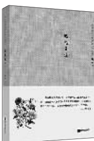
小说:《蓝袍先生》 作者:陈忠实 出版:江苏文艺出版社

本书介绍了中国从商周到清末这一漫长的历史时期中美容化妆品的发展历史、种类及其主要配方。内容分为“彩妆篇”、“美容美发篇”和“香身篇”三大部分。基本上涵盖了中国古代美化仪容的所有方面，是一部比较详尽地介绍中国古代妆容种类及其配方的著作。