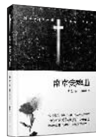
小说:《南京安魂曲》 作者:哈金 出版:江苏凤凰文艺出版社

本书通过对焦竑思想的系统性及其在明末清初思想脉络中的“时空性”分析，探讨中国近世思想史上的三大问题：晚明新儒学者内部“三教合一”运动的独特性；程朱与陆王之争所扮演的历史角色；清初汉学的论述意义”。这三大问题息息相关，显示出新儒内部思想的重构”。即“气的哲学”的出现，心性二元的瓦解和人心、道心二心说的崩溃等。