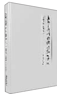
历史:《焦竑与晚明新儒学思想的重构》 作者:钱新祖 出版:东方出版中心

本书通过对焦竑思想的系统性及其在明末清初思想脉络中的“时空性”分析，探讨中国近世思想史上的三大问题：晚明新儒学者内部“三教合一”运动的独特性；程朱与陆王之争所扮演的历史角色；清初汉学的论述意义”。这三大问题息息相关，显示出新儒内部思想的重构”。即“气的哲学”的出现，心性二元的瓦解和人心、道心二心说的崩溃等。