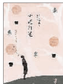
小说:《小说灯笼》 作者:(日)太宰治 出版:四川文艺出版社

《小丑之花》主角大庭叶藏与《人间失格》主角同名,描写的是叶藏殉情失败后进疗养院的事,但不同于《人间失格》中叶藏的自卑、怯懦、颓废,《小丑之花》里的叶藏,年轻、冲动又骄傲。太宰治在这篇作品里,剖析了他日后的巅峰之作《人间失格》里看似消极颓废、实际上却在绝境中求活的主角大庭叶藏的心路历程。