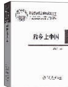
人类学:《后乡土中国》 作者:陈益龙 出版:商务印书馆

本书的初衷是想传承和发展费孝通先生“乡土中国”的思想和理论,尝试构建后乡土中国理论。为了把“后乡土中国”从一个概念术语转化为系统的理论概括,作者尝试着运用后乡土性框架去概括和解释当下乡村社会诸多方面的基本问题和基本性质,试图为人们理解中国乡村社会提供一个不同的视角。