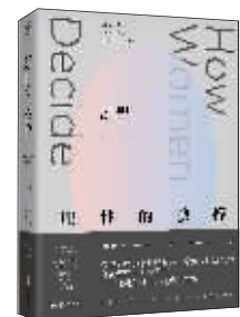
心理学:《理性的抉择:女性如何做决定》 作者:(美)休斯顿 出版:北京联合出版公司

本书是缅甸贡榜王朝巴基道王在位时,由蒙悦逝多林寺大法师、道加彬大法师、谏政大臣摩诃达马丁坚、大骑兵统领吴耀、内廷府传旨官吴前、负责灌顶加冕礼的婆罗门学者亚扎德瓦等13位僧俗学者奉旨在琉璃宫内参照缅甸国内各种史书、典籍、碑铭、档案文献、佛学经典和“雅都”“埃钦”“茂贡”等诗文分工编写而成的大编年史。