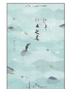
小说:《小丑之花》 作者:(日)太宰治 出版:四川文艺出版社

女性在做决定的时候是如何思考的?会面临什么样的评价?本书通过将现实中的有关女性决策的鲜活经验与众多专家的科学的研究结合起来,为我们解答了“女性是怎样做决定的”以及“女性应该如何更好地做出决定”两大问题。丰富而有说服力的事例,巧妙地将我们带入女性内心世界,让具体的决策思维一步步浮现出来。