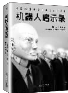
小说:《机器人启示录》 作者:(美)威尔森 出版:人民文学出版社

本书的故事发生在并不遥远的未来,主角是叫阿考斯的机器人,它有一张孩子的面孔,不过它的内心可并不纯洁。有一天,它掌握了全球网络的控制权,指挥人类制造的机器人反过来对抗人类……本书被誉为:科幻小说一直在探索关于计算机背叛人类和机器人暴动的主题,而威尔森为这类题材设计了新的思路。”