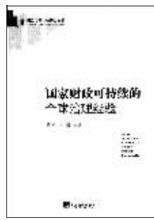
经济学:《国家财政可持续的全球治理经验》 主编:黄严 马骏 出版:中央编译出版社

本书通过严格考证,对列宁民主集中制的基本原理进行了解读,回答了民主集中制的职能和作用是什么、民主和集中是什么关系、党的民主集中制和民主制的区别是什么、实行列宁的民主集中制党章应当规定哪些要求等一系列重大政治理论问题,从不同角度对这些原理进行了多方位的解读,观点新颖,视角独特。