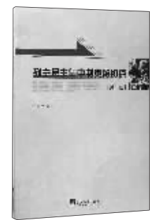
历史:《列宁民主集中制奥秘初探》 作者:张慕良 出版:中央编译出版社

本书的故事发生在并不遥远的未来,主角是叫阿考斯的机器人,它有一张孩子的面孔,不过它的内心可并不纯洁。有一天,它掌握了全球网络的控制权,指挥人类制造的机器人反过来对抗人类……本书被誉为:科幻小说一直在探索关于计算机背叛人类和机器人暴动的主题,而威尔森为这类题材设计了新的思路。”