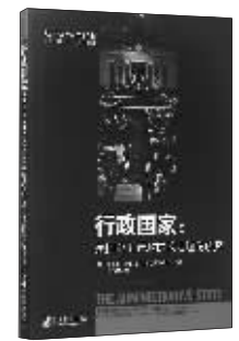
行政管理:《行政国家》 作者:(美)沃尔多 出版:中央编译出版社

自19世纪末以来,全球各国政府债务在战争和经济危机期间均呈现爆发式增长,形成国家主权债务危机,严重时可能导致政府无法偿还主权债务。面对这一难题,已有大量研究分析了陷入危机的各国形成债务风险的原因。面对经济危机,在大部分国家陷入政府债务泥潭之时,有一小部分国家却能平稳度过危机的冲击,并依然保持长期良好稳定的财政可持续发展。