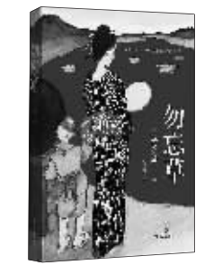
绘本：《勿忘草》 作者：(日)竹久梦二 出版：四川文艺出版社

在呈现苏东坡人生脉络和生命际遇的同时，作者选取故宫收藏的宋元明三个主要朝代的艺术藏品，由书、画及人，把苏东坡的精神世界和艺术史联系起来，由苏东坡个体的人生去反观他所处的时代。不单是苏东坡的个人传记，更书写了整个宋代的精神文化风貌。