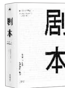
写作：《剧本》 作者：(美)理查德·伍尔特 出版：天津人民出版社

作为影视写作课程的内容大纲，本书涵盖了标准的剧本格式、剧本修改方法、真实的业界环境，30多年来被全世界一百多所大学当作教科书使用。作者讲授的影视写作课被《纽约时报》《华尔街日报》《洛杉矶时报》一致评价为富有传奇色彩，不仅桃李天下，更有学生接二连三地获得了奥斯卡、金球奖等奖项。