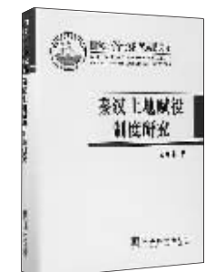
历史：《秦汉土地赋役制度研究》 作者：臧知非 出版：中央编译出版社

本书选择了“薯片袋”这一有着强烈美式风格的创意包装，这一袋袋诗集能像薯片一样，从书店走向街头，从小众走向人群，出现在地铁、便利店、自动贩售机，延伸进每一个生活场景中。我们将试图打破快消品与经典读物的疆域，在消费主义的时代里横冲直撞，让人与诗歌重新相遇。