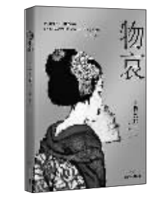
绘本：《物哀》 作者：(日)竹久梦二 出版：四川文艺出版社

可以更好地解读其作品。书中所选人物大多家喻户晓，名声显著，作者以这些人物的生平为纲，论述中加入了丰富的代表性作品的选段，并对这些才子们在文化上的成就与思想上的特色进行了独具一格的角度点评。 陈辉/文