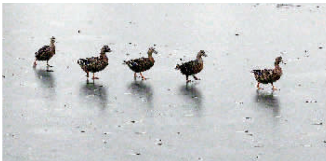
►北海公园,几只野鸭排队走在刚结冰的湖面上。