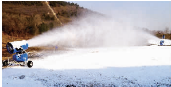
◀万龙八易滑雪场,两台造雪机对着喷出雪雾,像是在打雪仗。