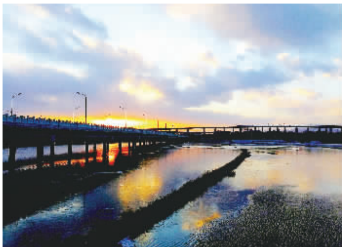
►卢沟桥晓月湖,铁路和桥梁在冬日晚霞的映衬下,增添了不少色彩。