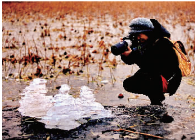
◀傍晚的玉渊潭内,一位女士正在拍摄三座冰塔。