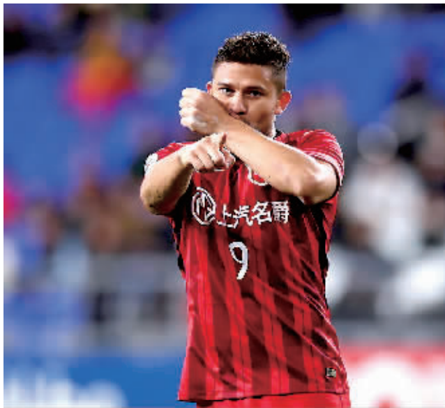
上港埃神庆祝进球。