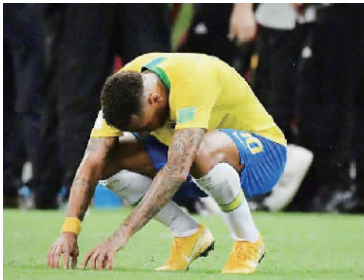
▲内马尔的出局有些遗憾。