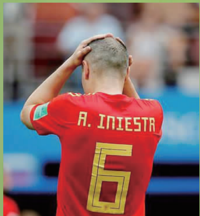
▼伊涅斯塔悲情告别。