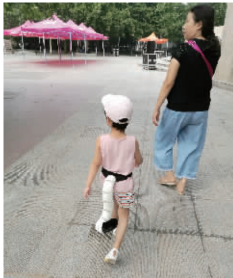
尾巴 惠新西街奥林匹克文化广场,一个小朋友戴着一个大尾巴,太可爱了。