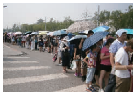
热情 正值暑期游览高峰,等待参观自然博物馆的人排着长队,酷暑也挡不住人们的热情。