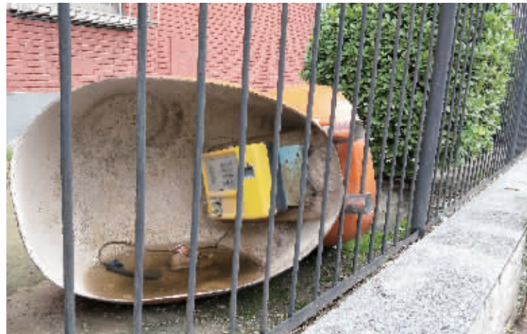
下岗 随着移动通信的高速发展,电话亭逐渐被淘汰。这是在海淀区街头看到一个废弃的电话亭,希望有关部门尽快清理,以免影响市容。