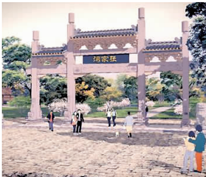
▲张家湾公园将以人文森林、候鸟森林、湿地森林为特色交融,形成副中心核心区的一道绿色屏障。