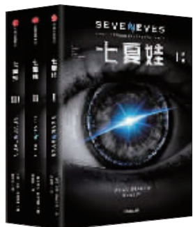
小说:《七夏娃》 作者:(美)斯蒂芬森 出版:中信出版社

本书是美国当代赛博朋克流硬科幻作家尼尔·斯蒂芬森的一部科幻长篇小说,述说了个非凡且异常的生命挑战故事。斯蒂芬森奔向月球,要带领读者进入外层空间,去讲述一个跨越五千年的太阳系故事,并最终回归到