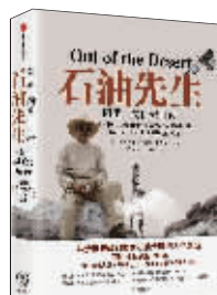
传记:《石油先生》 作者:(沙特)阿里·纳伊米 出版:灰犀牛·中信出版社

三十二岁的单身女人偶然有机会去了一趟东方,在德国的旅馆里,她结识了一些新朋友,旅行结束,她回到了马德里,一切似乎又回到正常。快要淡忘时,却发生了一系列同那次旅行相关的事件,最后,她发现自己竟卷入了一群苏联和英国的间谍当中,一种无奈、迷惘的感觉油然而生。本书不是间谍小说或侦探小说,作者着意表现普通人的喜怒哀乐和平凡生活。