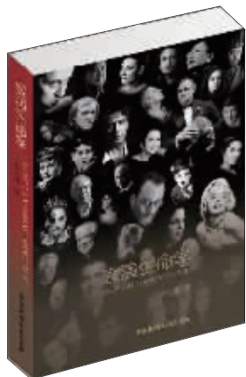
艺术:《表演生命学》 作者:林洪桐 出版:广播电视出版社

表演创作是什么?优秀表演、优秀演员的每一部作品都是他与她的生命的展开,灵魂的展露。要深入到人性层面,把心交出来,否则仅仅是匠艺活儿。技巧固然重要,失去了生命感觉,或者说失去