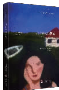
小说:《我们如此相爱》 作者:(智)马赛拉·塞拉诺 出版:中央编译出版社

在那个英雄辈出、诸侯并起的时代,游侠、儒家、法家、道家、兵家、纵横家……悉数登场,从秦崩、楚亡到汉兴,作者重新全景再现一场智慧与权欲的经典博弈。本书借助传世经典和出土文献,还原刘邦所处的历史情境,剖析历史成因,为您讲述刘邦从一介草民到一代帝王的传奇一生。本书被网友赞为:“插入的议论很有现代意识。”对读者来说,亦是一次有趣的阅读体验。