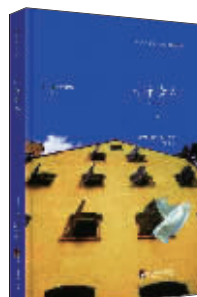
小说:《十个女人》 作者:(智)马赛拉·塞拉诺 出版:中央编译出版社

小说以女性的独特视角首开智利文学界先河,揭示了女性在社会中的地位和面临的各种问题。故事发生在1990年,有四个主人公人到中年、事业有成,时隔多年在湖边的一所房子里讲述她们过去的的生活。谈论童年、青年、政治生涯、生活处境、与男人的关系、孩子、爱情、伤痛、醒悟等。30年间,她们经历了阿连德政府、1973年军事政变、独裁统治甚至流亡国外。