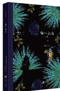
小说:《留住黑夜》 作者:(西)普埃尔托拉斯 出版:中央编译出版社

智利,Natasha是一名心理治疗师,约了九名接受治疗的女性患者来讲述她们各自的经历,这九个人的叙述以第一人称独立成章,共九章,第十章讲述Natasha,但是由她的助手陈述。这九名女性从19到75岁不等,不同的社会阶层、教育经历、出身、性取向和职业。每一章都讲述了她们每个人生命中最深刻最沉重的记忆:孤独、踌躇、不安、害怕和痛苦。